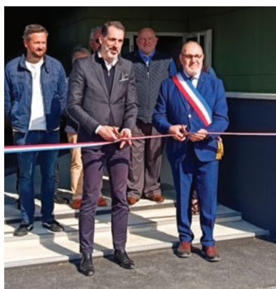
Coupe du ruban d'inauguration