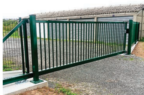
Portail des garages