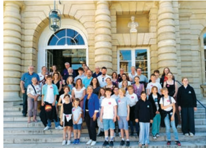
Les CMJ devant le Sénat

Le 28 Juin , les CMJ de Gouvix et Cauvécourt ont été invités par la sénatrice Sonia de LA PROVÔTÉ à venir visiter le Sénat. Ils ont eu la chance de découvrir le jardin du Luxembourg sous le soleil pour leur pique-nique, pour terminer par la visite du palais du Luxembourg où le Sénat inscrit son action dans une histoire riche et un patrimoine unique. Ils ont même pu assister à une séance dans l'hémicycle.