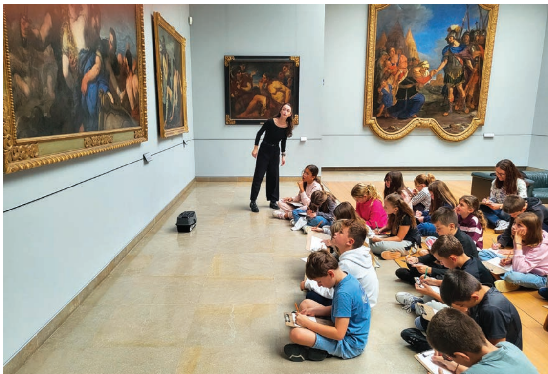
Musée des beaux-Arts de Caen