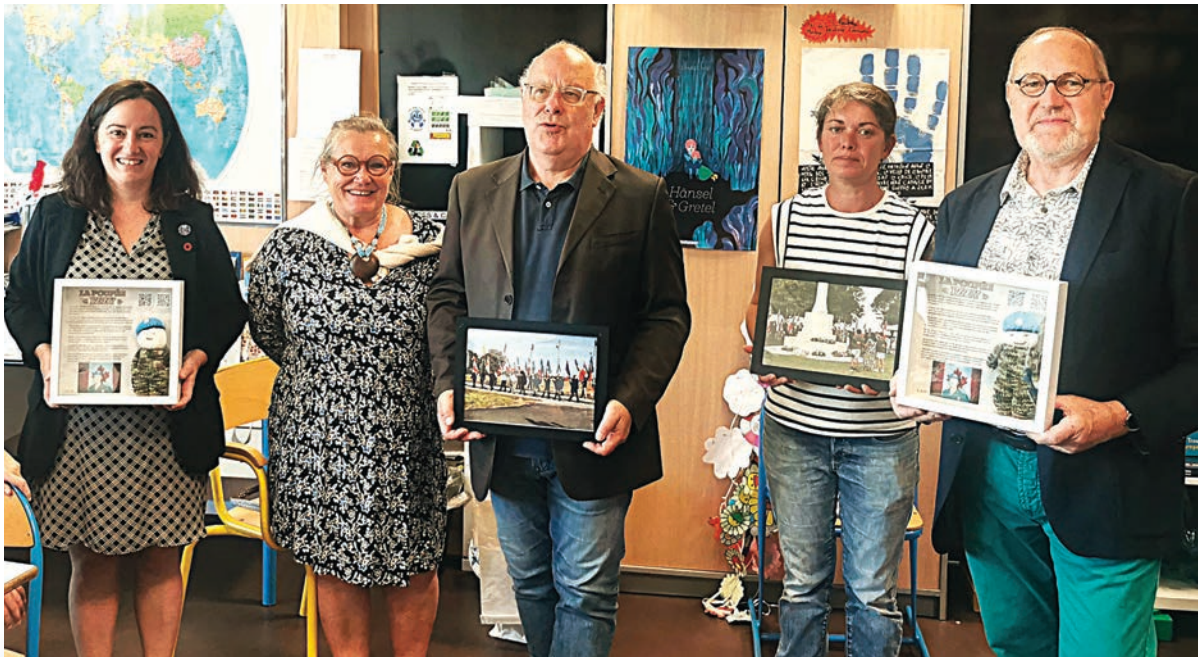
Les enseignantes et les maires des trois communes