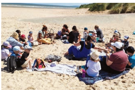
Collecte de déchets sur la plage de Merville-Franceville