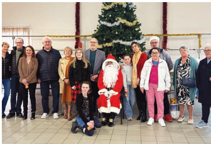
Les bénévoles, le conseil municipal et le CMJ autour du Père Noël

Une fois de plus, le Père Noël était à Gouvix le 13 décembre pour offrir des cadeaux aux enfants de Gouvix scolarisés à l'école du Roselin. Tous les enfants du CP au CM2 ont été gâtés. Les associations partenaires habituels (Pêche, Chasse, Rando gouvixoise, Gym et Club de l'Amitié) ont distribué des friandises. La nouveauté cette année est la participation du CMJ (voir page 5) pour récolter les dons de jouets et jeux anciens qui ne sont plus utilisés. Cette collecte se fera au bénéfice de l'association La Malle aux Trésors du Secours Catholique.