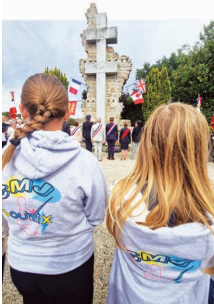
Cérémonie à Donnay

Le 27 avril , le CMJ a participé et aidé l'APE de l'école du Roselin à faire la chasse aux œufs pour Pâques.