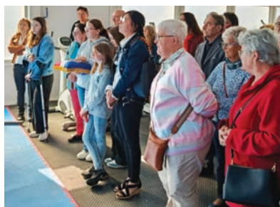
Spectateurs attentifs à la démonstration de full contact