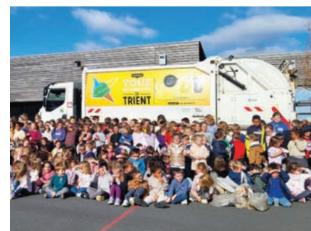
Nettoyons la Nature

Par ailleurs, nous poursuivons nos actions éco-citoyennes, comme l'opération Nettoyons la nature , qui s'est tenue en octobre, des petits jusqu'aux plus grands (en partenariat avec le Smictom), ou une découverte des arbres à Grimposq.