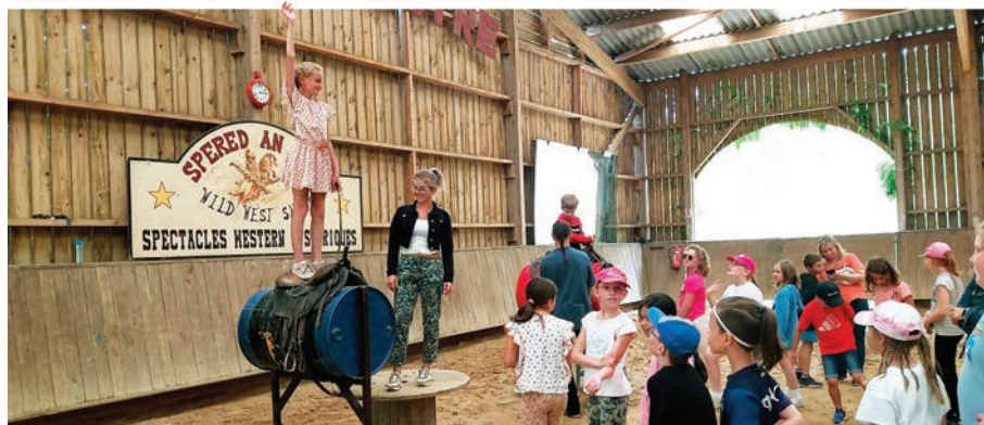
Théâtre équestre de La Pommeraye