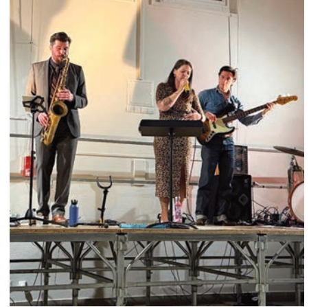
Miss Jue & Buddies